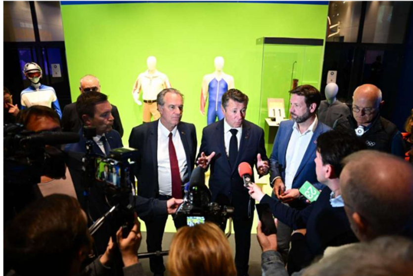
Lors de la visite du CIO au printemps 2024, le maire de Nice Christian Estrosi, entouré des deux présidents de région Renaud Muselier et Fabrice Pannekoucke au Musée du Sport dans l'Allianz Riviera.