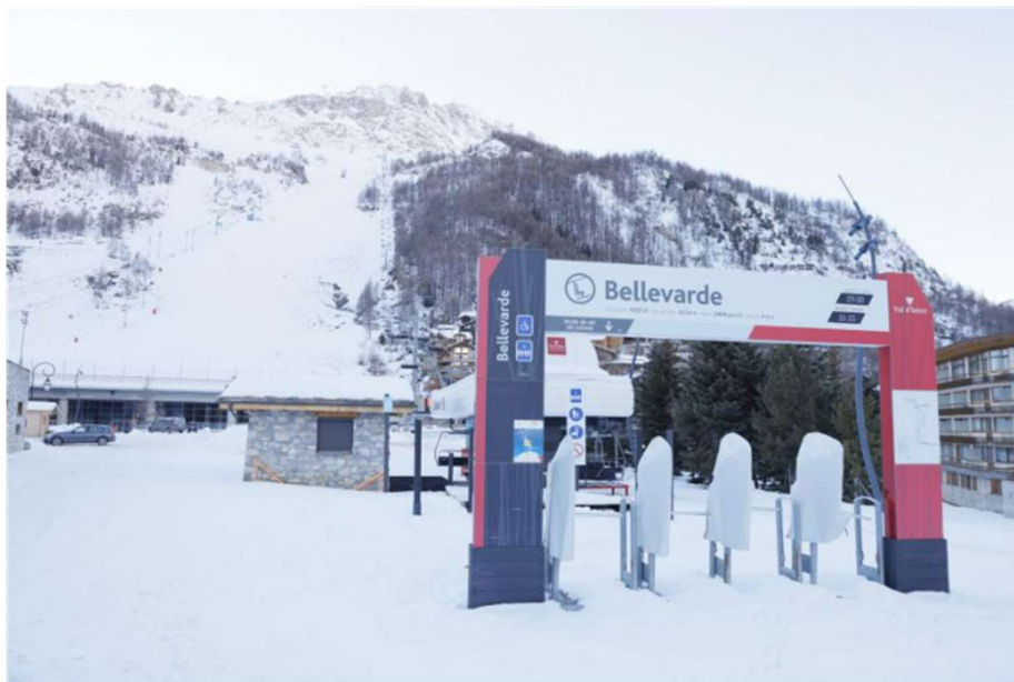
La célèbre face de Bellevarde à Val d'Isère pourrait accueillir des épreuves lors des Jeux 2030.

Le maire de Méribel a refusé de n'accueillir que les épreuves paralympiques, comme lui a proposé Edgar Gossion ce jeudi matin, le comité souhaitant répartir les épreuves de ski alpin entre Courchevel et Val d'Isère. Méribel se retire donc de l'aventure des Jeux d'hiver 2030.